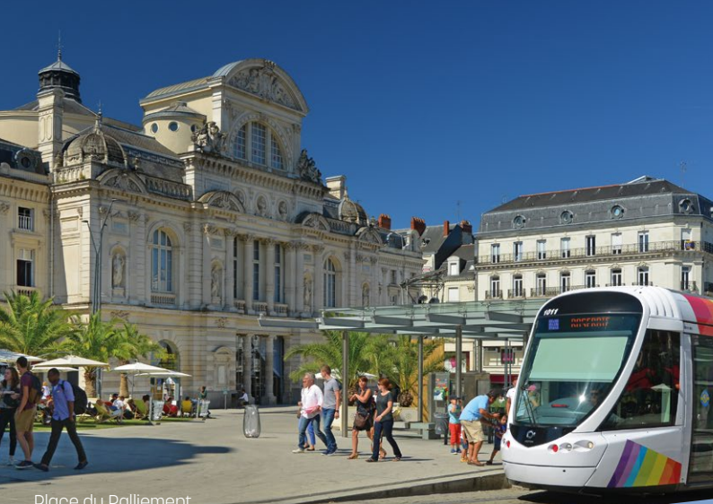
Place du Ralliement, centre-ville