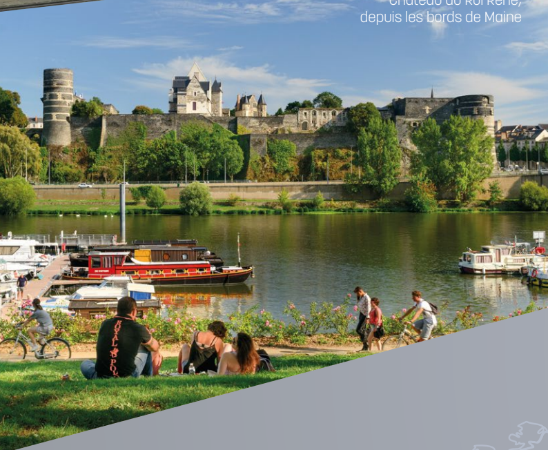
Château du Roi René, depuis les bords de Maine